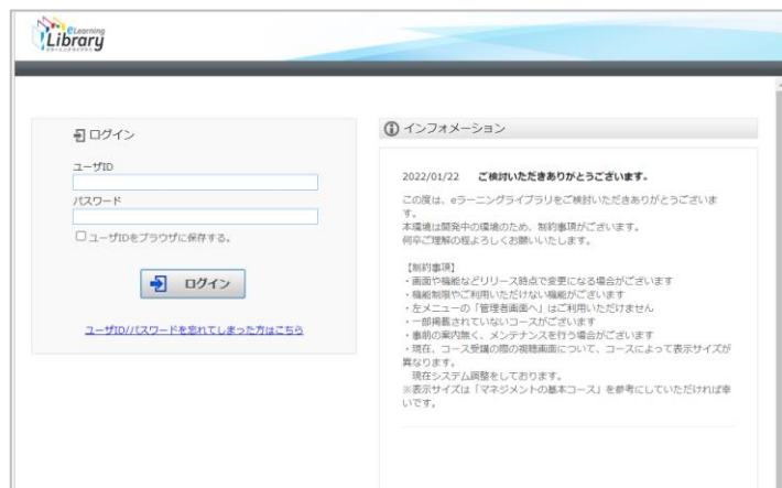
管理者サイトにアクセス https://jmam.study.jp/