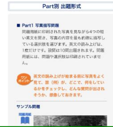
各Partの出題形式と解答のコツ

最新の出題形式を反映した模擬問題と充実した解説により、 時間配分の確認やこれまでの復習など、テスト直前の総仕上げができます。 各設問の解説をもとに、自分の解答内容を復習することで、 TOEIC本試験に備えます。